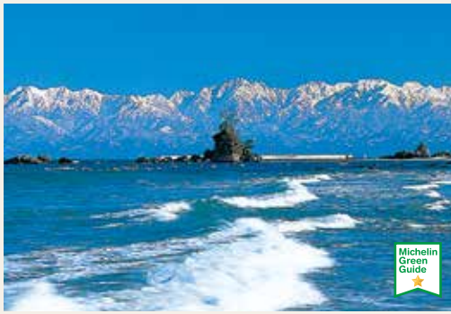
国定公园 雨晴海岸