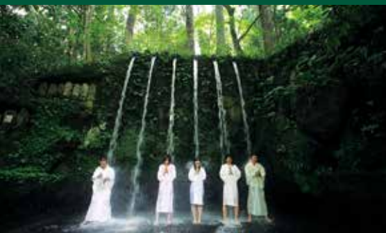
大岩日石寺 瀑布修行体验