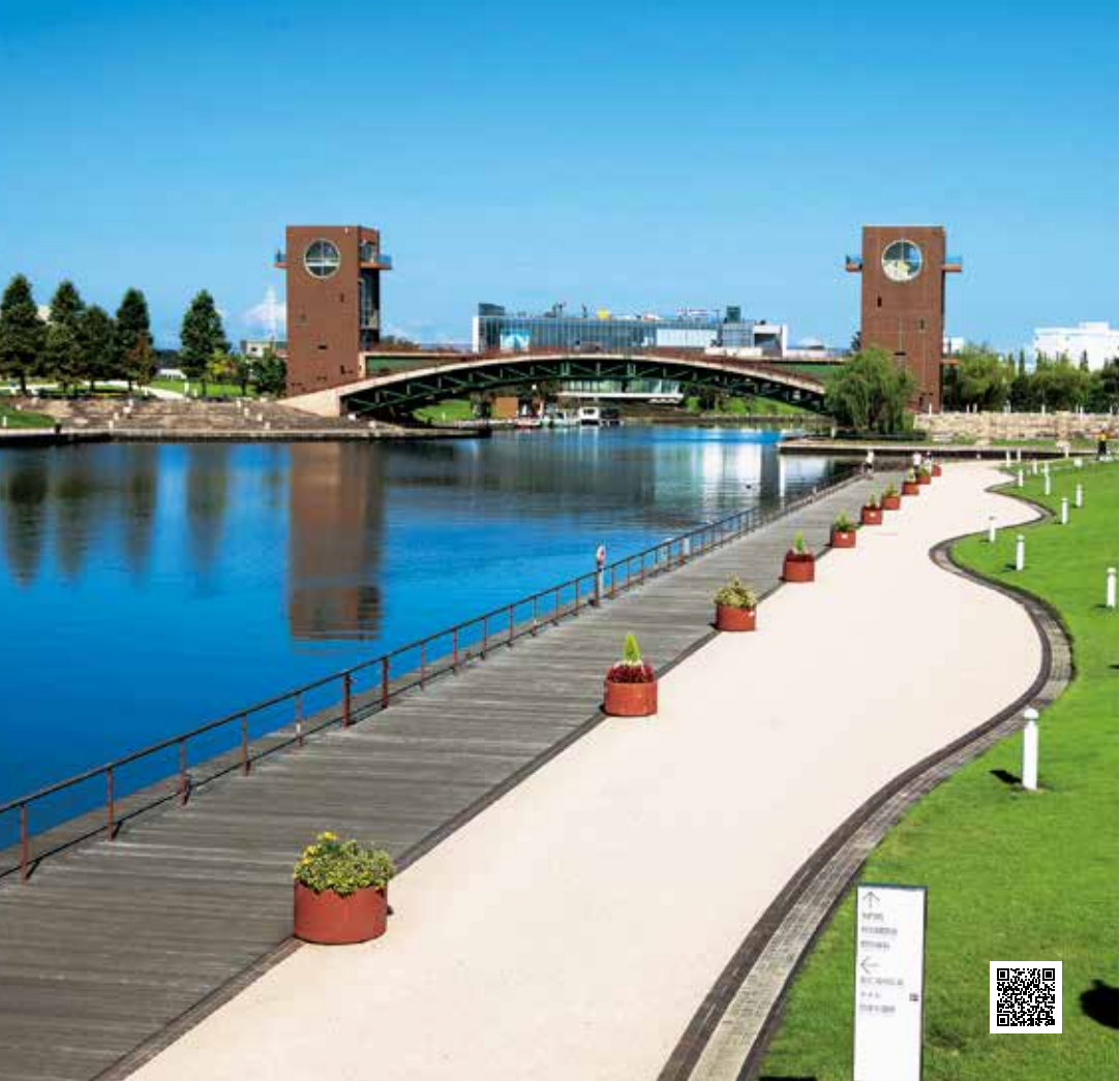
富岩运河环水公园